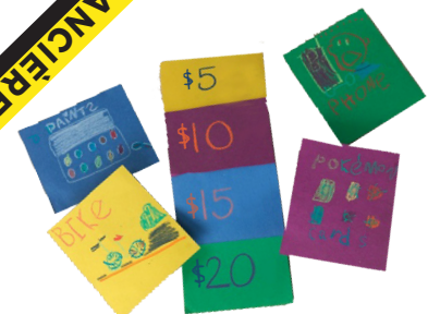
Planifie les achats

PRÉSENTE ton dessin à ta famille et à tes amis, puis explique le problème lié à l'argent que tu as illustré et comment tu peux t'en protéger.