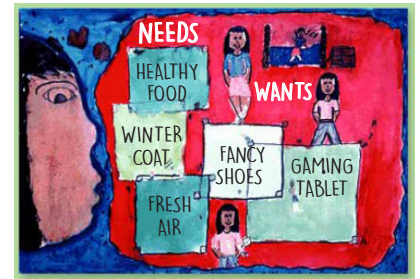
Équilibrer les désirs avec les besoins