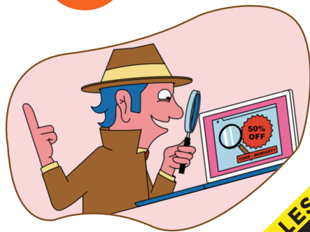
Détective et consommateur futé

CRÉE un dessin qui montre comment tu évites un problème lié à l'argent .