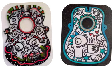
Gitarrenkunst von Kate Micucci

Bitten Sie die Schüler mit dem Originelle Gitarrendecken Arbeitsblatt, auf Gitarrenmusik zu REAGIEREN , indem sie sich vorstellen, wie sich verschiedene Klänge anfühlen und wie sie in der Kunst aussehen könnten. Wenn genügend Zeit ist, wäre es gut, mit einer Körperbewegungsübung zu beginnen, bevor die Schüler Klänge Skizzen visualisieren. Bitten Sie die Schüler, sich – wenn möglich – hinzustellen und Arme oder Beine auszustrecken, während sie in einem eigenen Raum bleiben, der andere nicht beeinträchtigt. Während sie Gitarrenmusik hören, bitten Sie sie, sich so zu bewegen, wie es die Klänge als Inspiration vorgeben. Besprechen Sie mit den Schülern nach der Bewegungserfahrung die Wörter, die in der bildenden Kunst verwendet werden und als Prinzipien der Gestaltung bekannt sind: Rhythmus, Muster, Ausgewogenheit, Betonung, Harmonie, Vielfalt und Bewegung. Fragen Sie sie, wie diese gleichen Begriffe auf die Klänge zutreffen, die sie gehört haben.