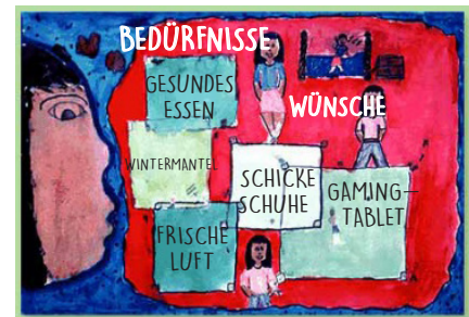
Wünsche mit Bedürfnissen in Einklang bringen