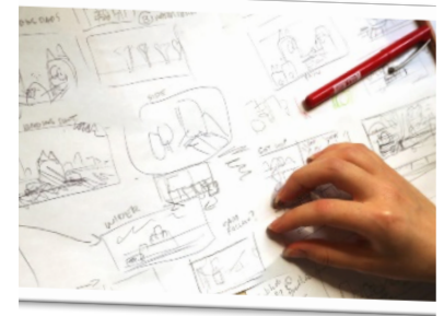
Storyboard von Jasmine „Jazz“ Moody

Interaktionen der Figuren, Orte und die Abfolge der Ereignisse am Anfang, in der Mitte und am Ende der Geschichte darzustellen.