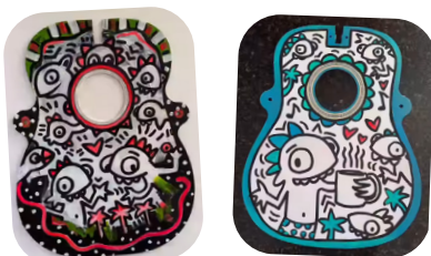
Arte en la guitarra por Kate Micucci

Usando la hoja creativa: Tapas de guitarra originales , pide a los alumnos que RESPONDAN a la música de guitarra visualizando cómo podrían sentirse y verse varios sonidos en el arte. Si hay tiempo, sería genial empezar con un ejercicio de movimiento corporal antes de que visualicen los sonidos en los bocetos. Pide a los alumnos que se pongan de pie como puedan y extiendan los brazos o las piernas, pero que permanezcan en un espacio que no estorba a los demás. Mientras escuchan la música de la guitarra, pídeles que se muevan según les inspiren los sonidos. Después de la experiencia de movimiento, repasen las palabras que se usan en el arte visual, conocidas como los principios del diseño: ritmo, patrón, equilibrio, énfasis, armonía, variedad y movimiento. Pregúntales cómo se aplican esas mismas palabras a los sonidos que escucharon.